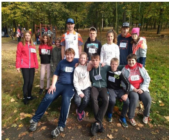
Běh Mostnou horou