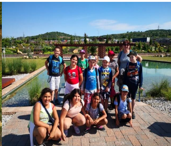
Cvičení v přírodě