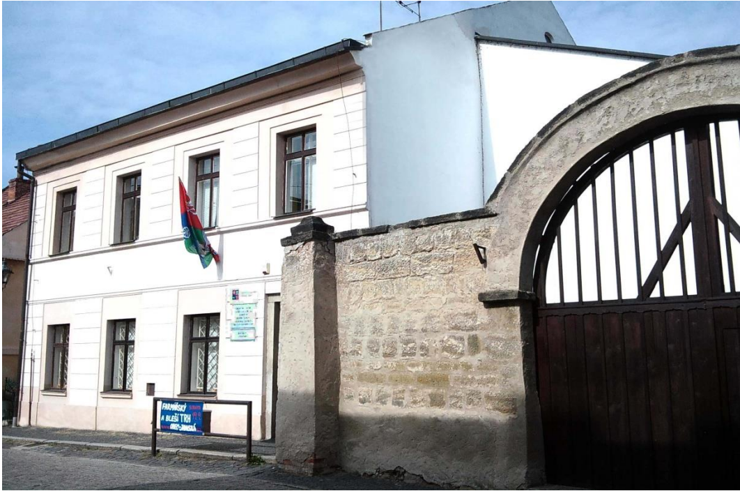
Budova ZŠ praktické, 1. máje 59, Ústěk