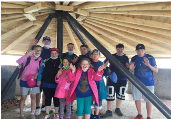
Škola v přírodě