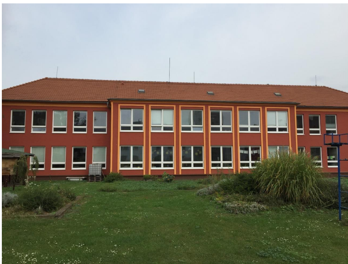
Budova ZŠ praktické, Mírová 225, Lovosice