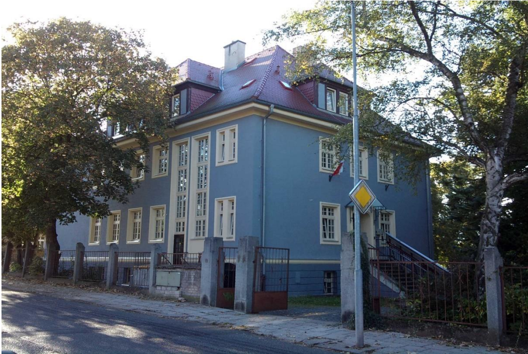
Budova ZŠ speciální SPC, Dalimilova 2, Litoměřice