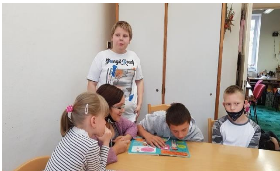
Zdraví není věda