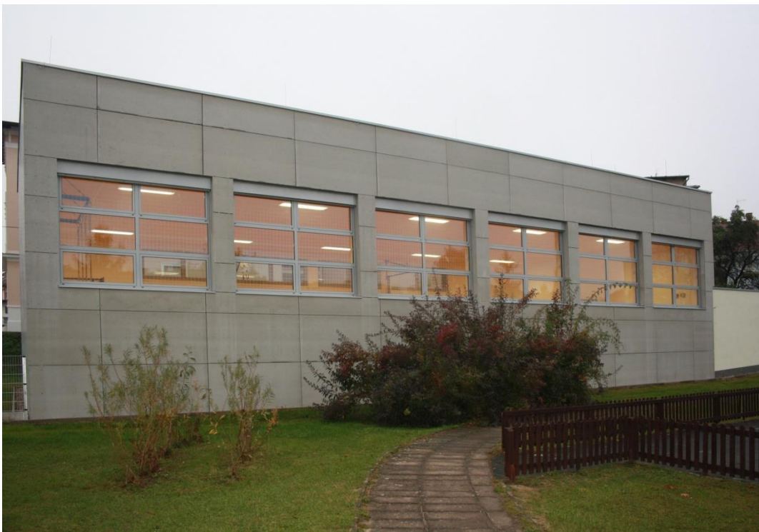
Tělocvična, Šaldova 6, Litoměřice