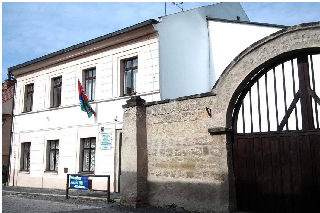
Budova ZŠ praktické, 1. máje 59, Ústěk