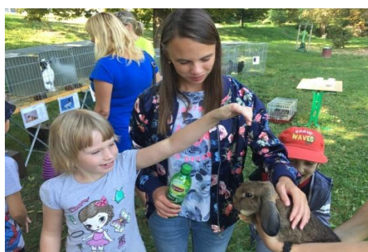
Vycházka do přírody