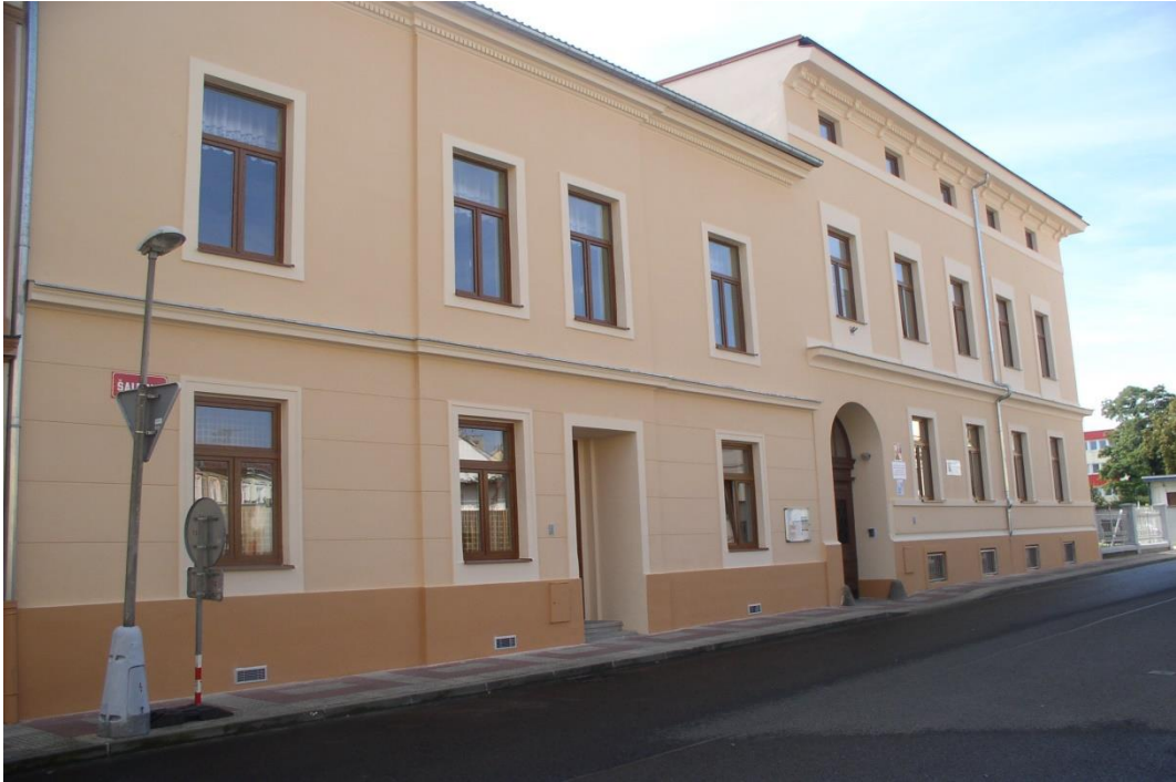
Budova ZŠ praktické a Praktické školy dvouleté, Šaldova 6, Litoměřice