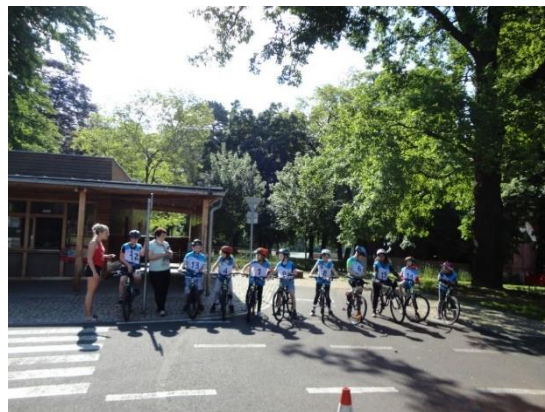
Dopravní výchova – průkaz cyklisty