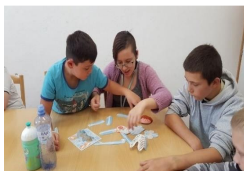
Zdraví není věda