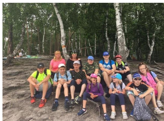
Poznáváme okolí Lovosic