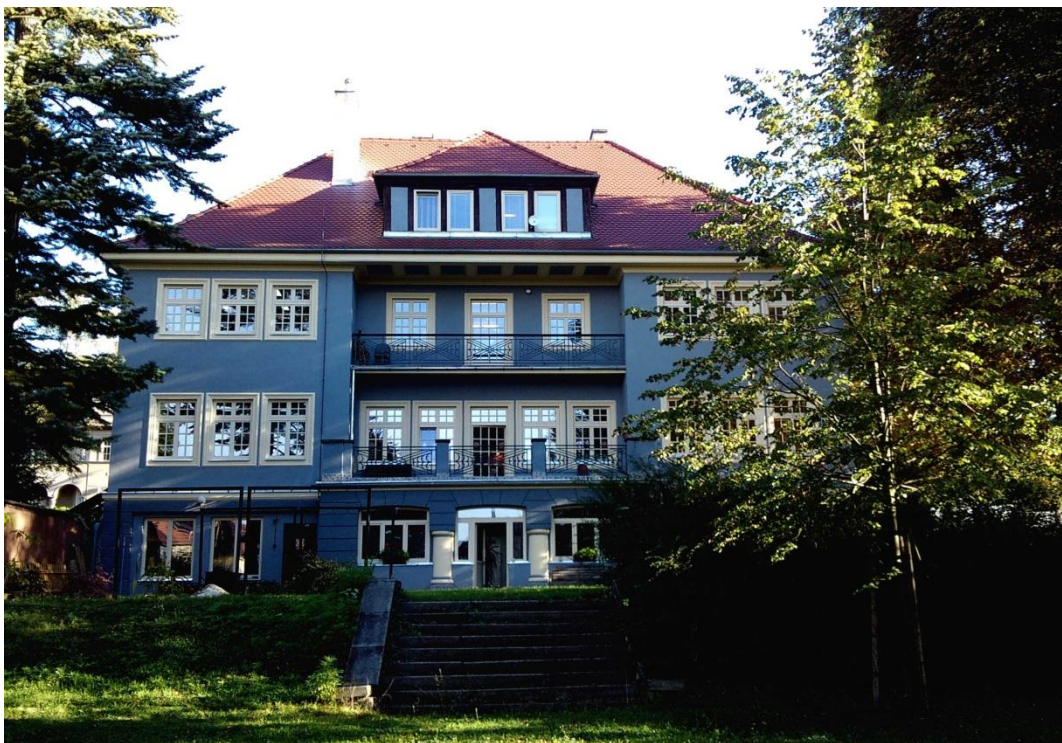
Budova ZŠ speciální SPC, Dalimilova 2, Litoměřice (pohled ze zahrady)