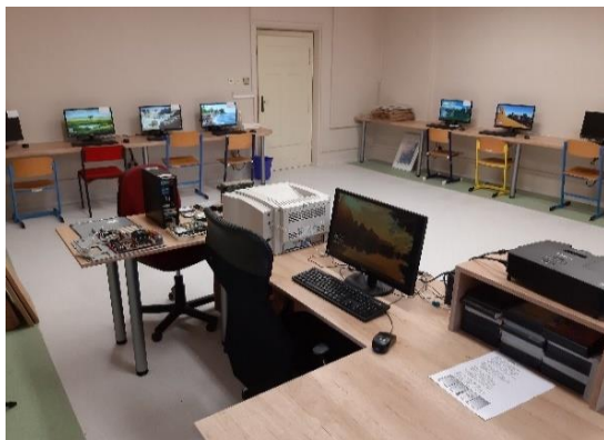
Nová počítačová učebna