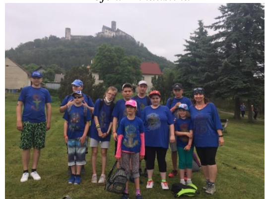
Škola v přírodě