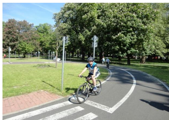
Dopravní výchova – průkaz cyklisty