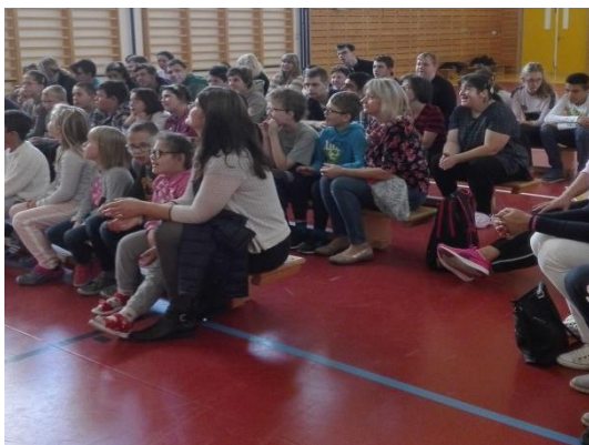
Pohádka „O Koblížkovi“