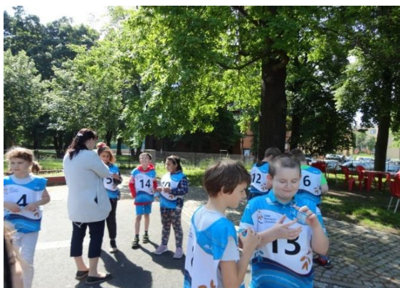
Dopravní výchova - průkaz cyklisty